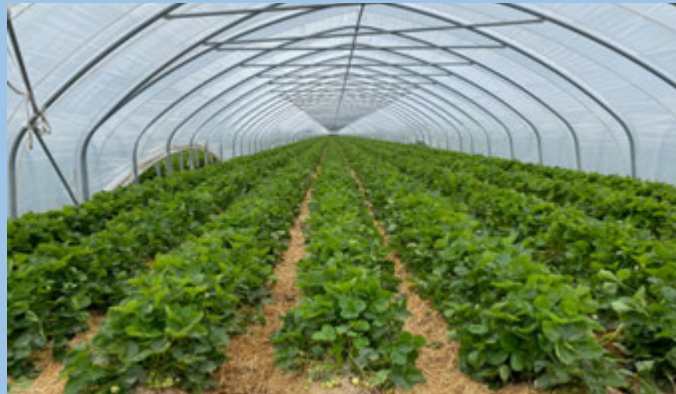
Versuchsanlage im Rheinland: Tunnelkultur, wüchsige, einheitliche Bestände