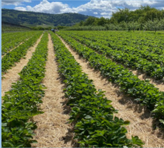
Freilandkultur Anbaubetrieb in Oberkirch: Stabiler Feldbestand