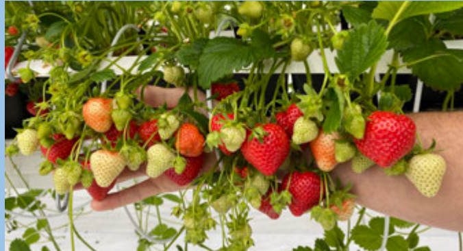
Versuchsanlage in Dresden: Substratkultur in der Rinne